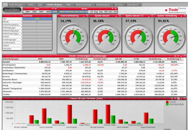
Umsatz nach Artikelhauptgruppen und Vertreter